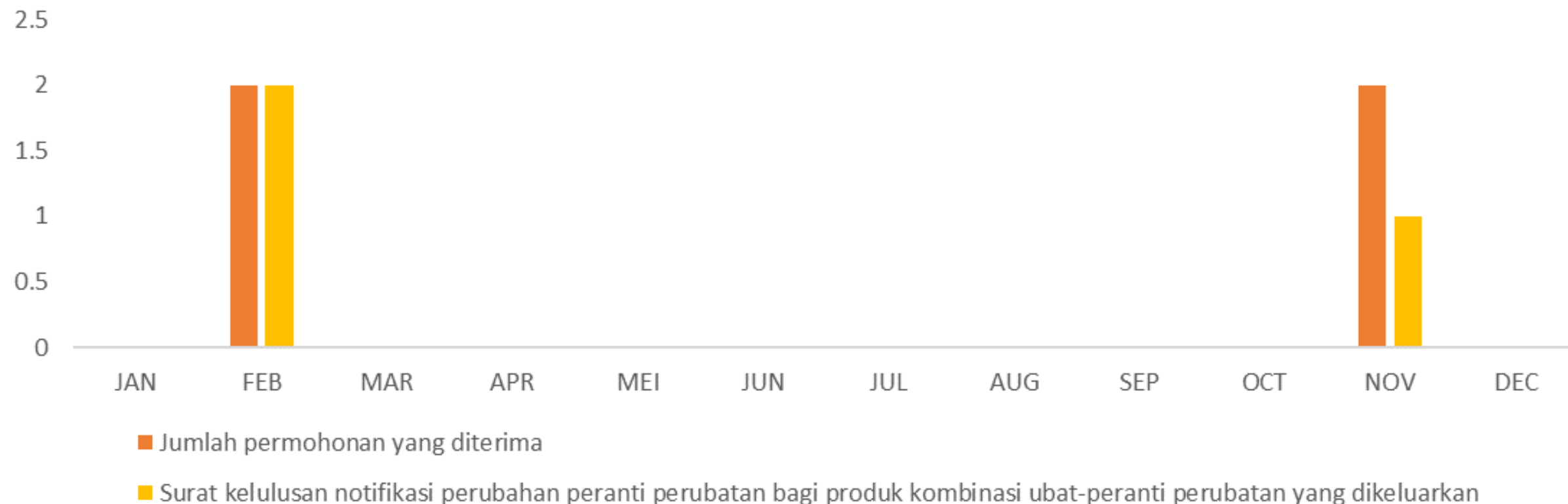
JUMLAH PERMOHONAN SURAT KELULUSAN NOTIFIKASI PERUBAHAN YANG DITERIMA PADA TAHUN 2023